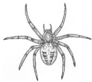
l'épeire diadème araignée des jardins

Nous avons trouvé surtout 2 sortes d'araignées :