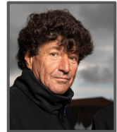
Jean Le Cam

Jean a 61 ans. Il participe au Vendée Globe pour la 5ème fois. On le surnomme "le roi Jean".