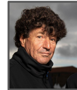
Jean Le Cam

Jean a 61 ans. Il participe au Vendée Globe pour la 5ème fois. On le surnomme "le roi Jean".